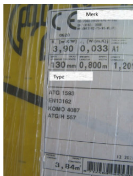
Foto van de isolatiedikte en foto van het etiket op de aangeleverde isolatie waaruit merk en type duidelijk worden. Wanneer mogelijk in combinatie met plaats van levering (bouwplaats). De dikte van isolatiemateriaal kan worden vastgelegd door een duimstok op de foto mee te fotograferen. Op de foto moet duidelijk zijn dat de duimstok aanligt tegen de binnenwand en dat de duimstok loodrecht op de dikte van het isolatiemateriaal staat.