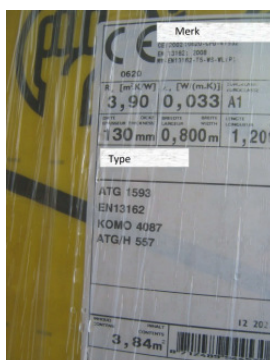
Foto van de isolatiedikte en foto van het etiket op de aangeleverde isolatie waaruit merk en type duidelijk worden. Wanneer mogelijk in combinatie met plaats van levering (bouwplaats).

De dikte van isolatiemateriaal kan worden vastgelegd door een duimstok op de foto mee te fotograferen. Op de foto moet duidelijk zijn dat de duimstok aanligt tegen de binnenwand en dat de duimstok loodrecht op de dikte van het isolatiemateriaal staat.